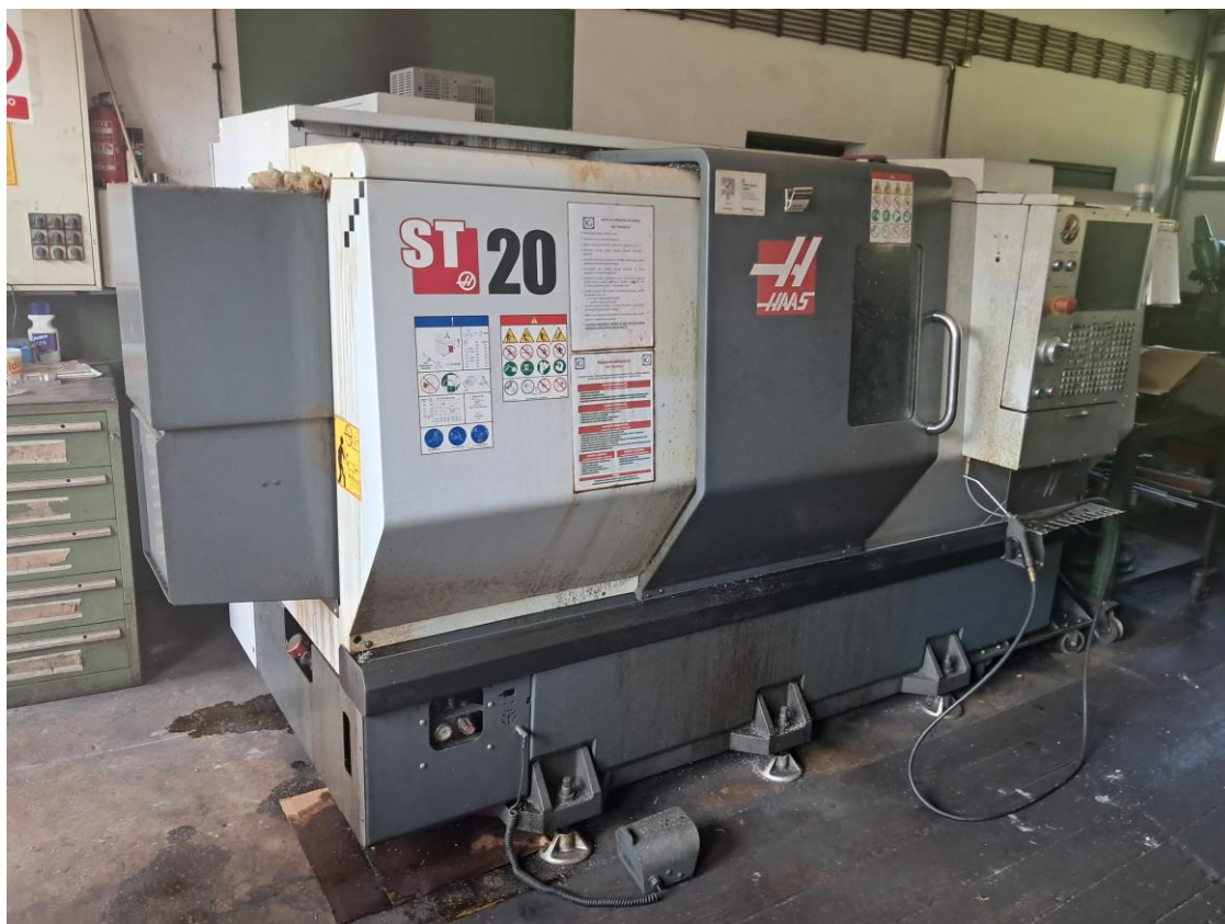
Slika br. 1